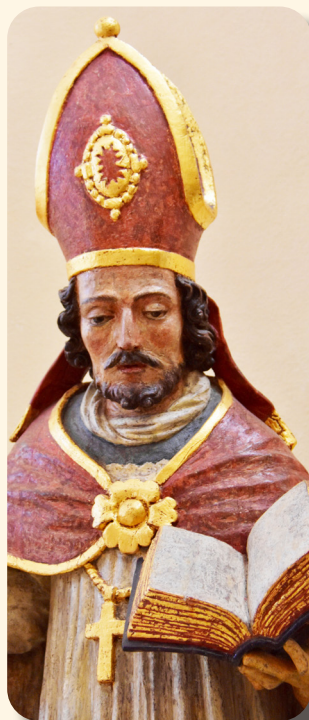
Willibrord-Statue Junglinster