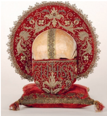
Reliquienkopf aus Martioda (Baskenland)