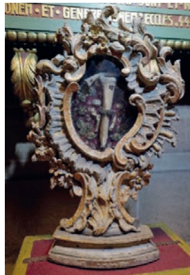
Ein Reliquiar in Echternach