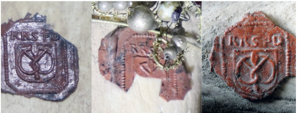
Von links nach rechts: die Siegel aus Echternach, Melsbroek und Martioda

Die wahre Überraschung und Freude kam, als wir am 18. August dieses Jahres persönlich die Reliquienkammer besuchten. In einem der Reliquiare, befinden sich zwei Knochen, die mit kleinen roten Wachssiegeln authentifiziert sind, die genau den Siegeln entsprechen, die wir bereits in Melsbroek (Belgien), in Orduña (Bizkaia, Baskenland) und in Martioda (Álava, Baskenland) gefunden hatten. Mehrere dieser Reliquien gehören zu den Märtyrern der Thebanischen Legion, die von Sankt Mauritius angeführt wurden und wegen ihrer Weigerung, heidnische Götzen anzubeten, den Märtyrertod starben. Ihre Hauptgruft befindet sich unter der Basilika Sankt-Paulinus in Trier. Dank dieser Siegel können wir schließen, dass die Reliquien von Echternach, Melsbroek, Orduña und Martioda miteinander in Verbindung stehen, da sie alle aus Trier stammen.