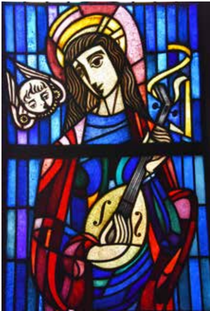
Hl. Cäcilia Beaufort

Am 22. November feiert die Kirche das Fest der heiligen Cäcilia, am 25. November das Fest der heiligen Katharina - zwei der beliebtesten Heiligen der Kirche.