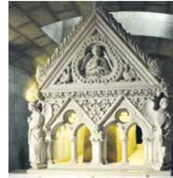
Châsse reliquaire de St Willibrord