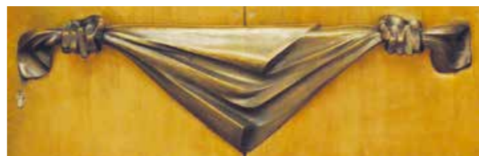
// Pousoir de la porte du Centre de Documentation

La Procession Dansante est probablement une adaptation d'un rituel païen repris par les missionnaires chrétiens de l'époque. Des écrits anciens font savoir que depuis le 11 ème siècle les paroisses dépendantes de l'abbaye étaient obligées de participer aux processions de la dîme. Un document de 1497 atteste la participation d'un groupe dansant lors d'une terrible épidémie, les paroissiens de Waxweiler avaient promis de venir « sauter » à Echternach s'ils en réchappaient. Sa mélodie originelle est un air populaire qui a été harmonisé au début du 20 ème siècle par le musicien epternacien Max Menager.