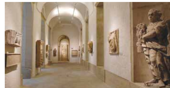
// Musée lapidaire