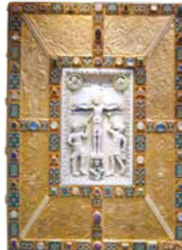
Couverture du Codex Aureus Epternacensis