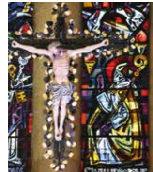
La croix suspendue au-dessus de l'autel