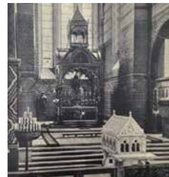
Chœur avant 1938