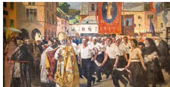
// Tableau de Lucien Simon