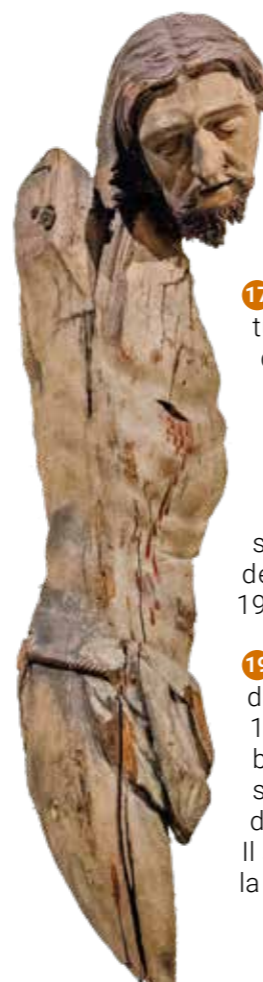
// Torse du Christ

16 Le grand tableau illustrant la Procession Dansante est une peinture de l'artiste Lucien Simon. L'œuvre avait été commandée par le gouvernement luxembourgeois pour l'exposition internationale de 1937 à Paris.