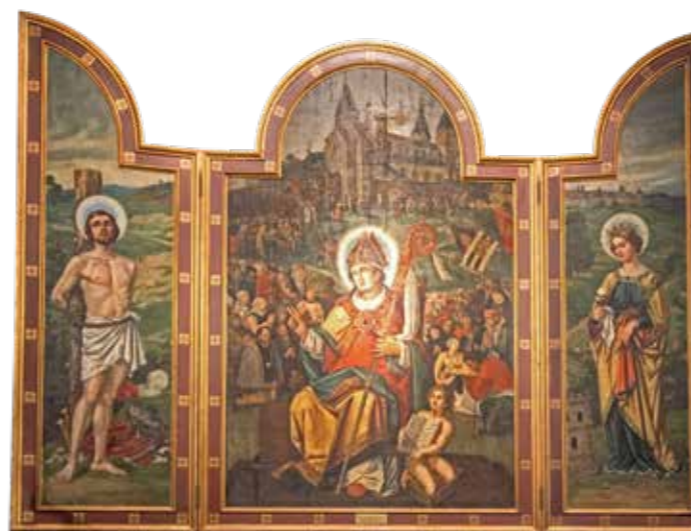
// Saint Willibrord bénissant les pèlerins

Deux dates de l'histoire d'Echternach sont mentionnées : en 1794, le pillage de l'abbaye par les soldats français et en décembre 1944, la destruction des tours occidentales de la basilique durant la bataille des Ardennes.