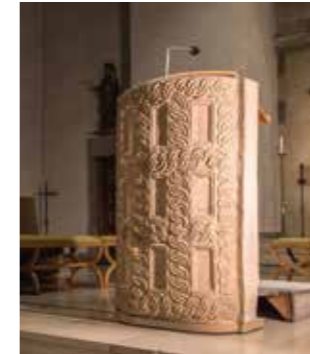
Ambon orné d'entrelacs celtes