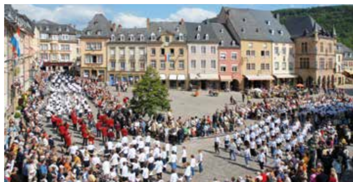
// Procession Dansante d'Echternach

Œuvre Saint-Willibrord | Photos: P. Barone, U. Fielitz, T. Osborne | kacom.lu , ORT MPSTL | Plan: HLG Ingénieurs-Conseils sàrl | Design: kacom.lu