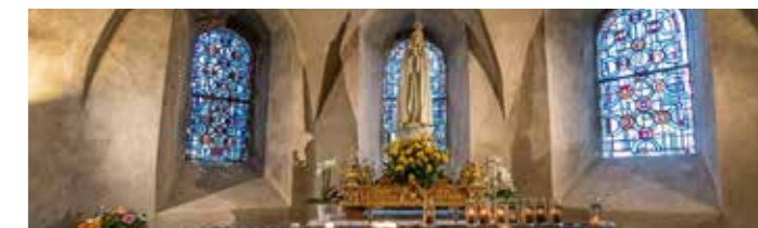
Chapelle Notre-Dame de Fatima

E Deux sarcophages mérovingiens encore cimentés, nul ne sait ce qu'ils contiennent.