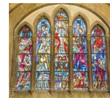
// Glorification de St Willibrord

Après la guerre de 1940-45, la basilique a été reconstruite en pierre de grès de trois couleurs différentes provenant de la Région Mullerthal (gris-vert, jaune et rouge).