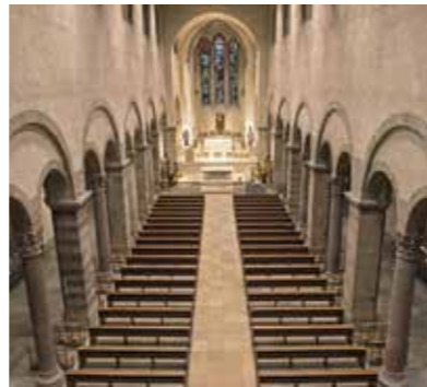
Architecture rarissime du vaisseau principal