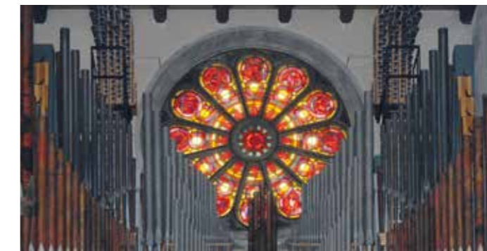
// Rosace et orgue de Klais

L'escalier du côté gauche permet de rejoindre le bas-côté de la basilique.