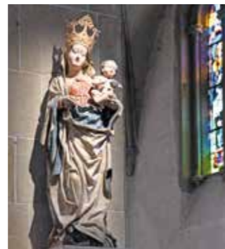
Vierge à l'Enfant