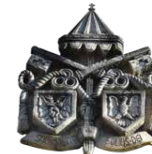
// Armoiries de la façade ouest